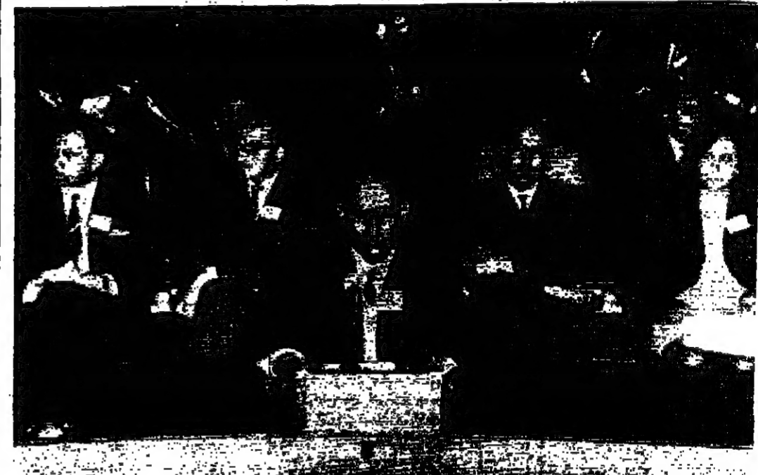
الوفد الاردني الى مؤتمر الصحفيين العرب بالقاهرة خلال جلسة الافتتاح خاصة بالسنور